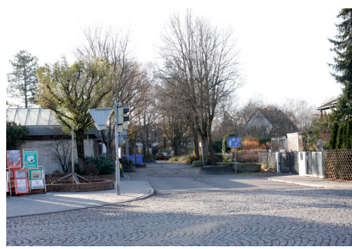
2 Aufpass-Stelle Rotwandstraße / Gernerplatz Hohes Verkehrsaufkommen durch Autos und Fahrräder.