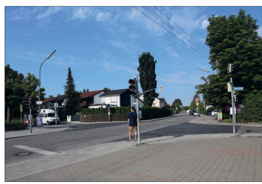
1 Aufpass-Stelle Alpenstraße / Lagerstraße Besonders morgens sehr hohes Verkehrsaufkommen.