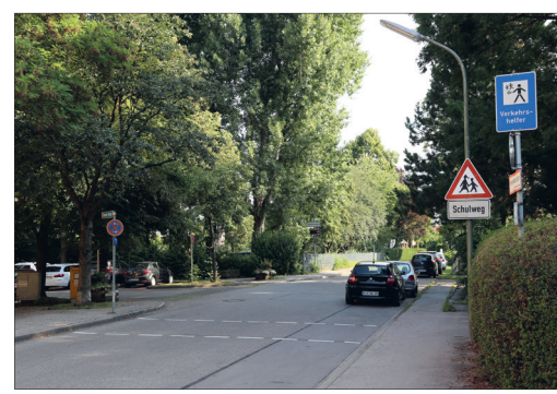
3 Aufpass-Stelle Bäumelstraße / Gernerplatz Unübersichtlicher Bereich. Nicht direkt an der Kurve die Straße überqueren. Schulweghelfer-Übergang benutzen.